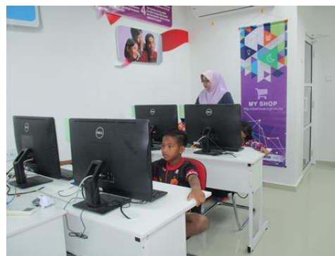
Gambar 5 – Petugas sedang membimbing pelajar menyiapkan tugas