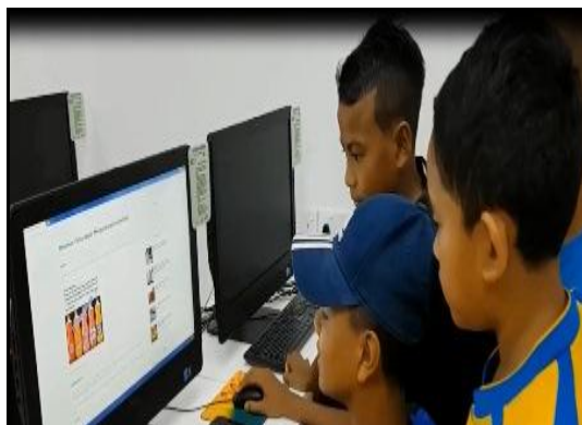
Gambar 2 - Peserta sedang berbincang dan sama-sama memberi idea yang bernas