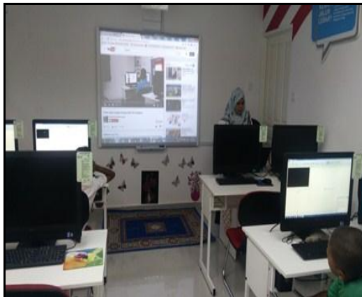
Gambar 1- Peserta sedang diberi penerangan oleh petugas bagaimana apa yang perlu dilakukan dan melihat contoh di youtube.