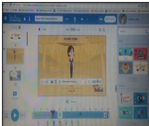
Gambar 5 – Pelajar juga menghasilkan video menggunakan aplikasi powtoon