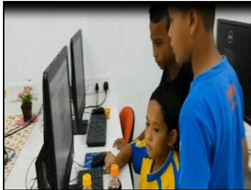
Gambar 4 – Pelajar masih berbincang untuk menghasilkan video yang terbaik