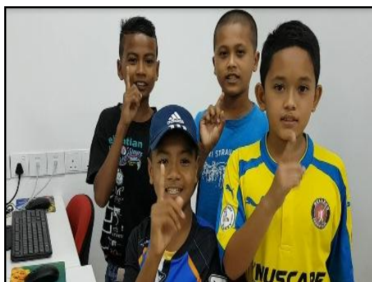
Gambar 3 – Peserta sedang membuat penggambaran video pendek

match photos with caption Pastikan gambar sepadan dengan keterangan