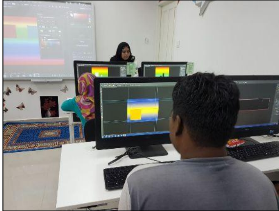
Gambar 1- Petugas sedang memberi penerangan