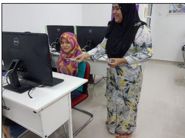
Gambar 5 – Petugas sedang memberi cenderahati kepada peserta

Photo caption names Keterangan gambar beserta nama