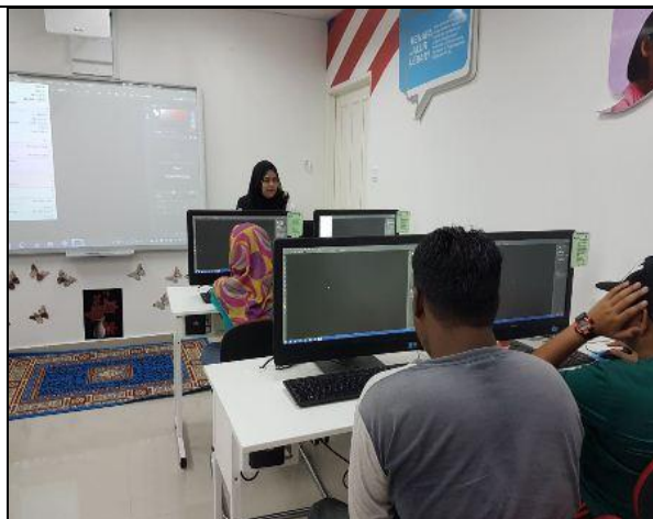
Gambar 4 – Pelajar yang telah siap tugas telah diberi tugas yang baru supaya mereka lebih faham