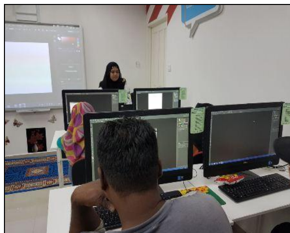
Gambar 3 – Peserta sedang tekun menyiapkan tugas

photos with caption Pastikan gambar sepadan dengan keterangan