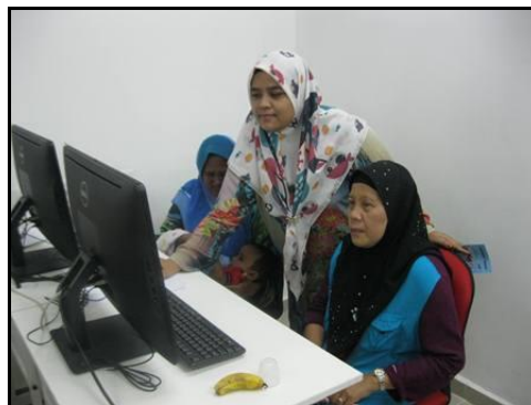
Gambar 3 – Peserta sedang tekun mendengar penerangan daripada petugas