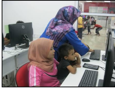
Gambar 1- Petugas sedang memberi penerangan tentang pengenalan asas internet

match photos with caption Pastikan gambar sepada n dengan keterangan