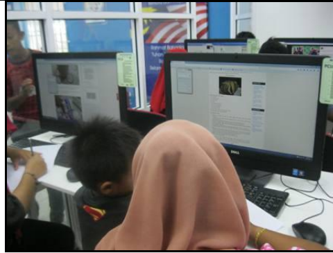
Gambar 4 – Peserta sedang tekun membaca dan mencari resepi